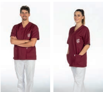
Kinésithérapie, ergothérapie, logopédie, pharmacie, biomédical, technicien en appareillage médical