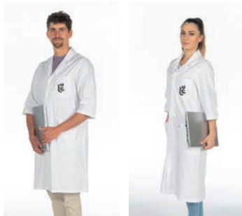
Blouse 3/4 (médecins et administratifs)