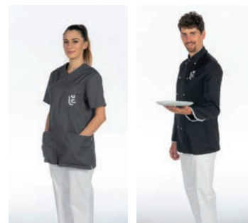
Département logistique (alimentation, entretien ménager, logistique interne)