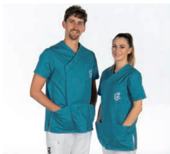
Institut de médecine dentaire et stomatologie