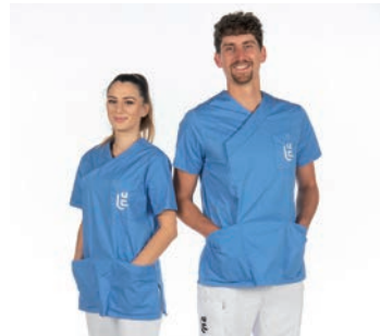
Infirmiers et aide-soignants