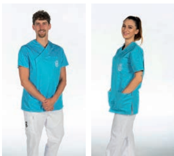
Support soignants (AIA, AEL, brancardiers, stérilisation...)