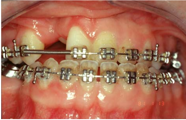
avant chirurgie orthognathique