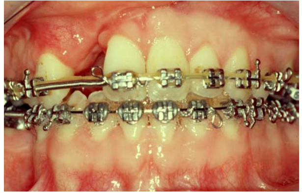
après chirurgie orthognathique