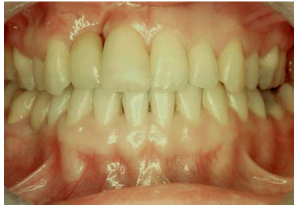
....et en fin de traitement